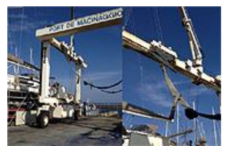
50t lyfta 37.000 GBP/ 5,1 millj