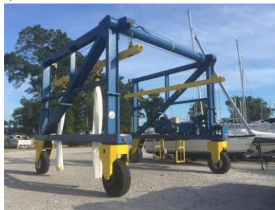
30t 24.500 USD/ 2,8 millj