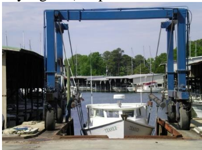
40t 37500 USD /4,2 millj

Um væri að ræða að kaupa notað eldra tæki. Hér eru nokkur sýnishorn af slíkum tækjum og verð til að gefa félagsmönnum hugmynd um kostnað án þess að það hafi verið skoðað gaumgæfilega. Þessi ræki eru að vísu í ódýrari og eldri kantinum en gætu dugað. Steypa þyrfti við vegg í rampi austan megin og eitthvað meira sem þyrfti að gera. Viðmið væri líklega 25 t. lyftigeta (kaupverð erlendis án vsk)