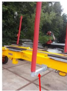
Figure 2 Guide poles